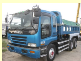
いすゞ ダンプ KC-CXZ81K1D H8 ¥3,800,000