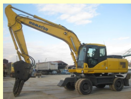
KOMATSU PW200-7 2005y ¥7,800,000