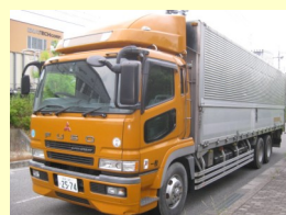
三菱 ウイング KL-FU50JUJ H16 ¥2,900,000