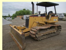
CAT D3C 1996y ¥2,800,000