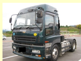
いすゞ トラック PJ-EXD52D6 H18 ¥4,700,000