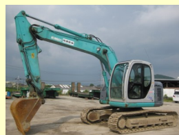
KOBELCO SK135SR-1E 2004y ¥3,700,000