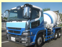
三菱 ミキサー BDG-FV50JX H19 ¥8,500,000