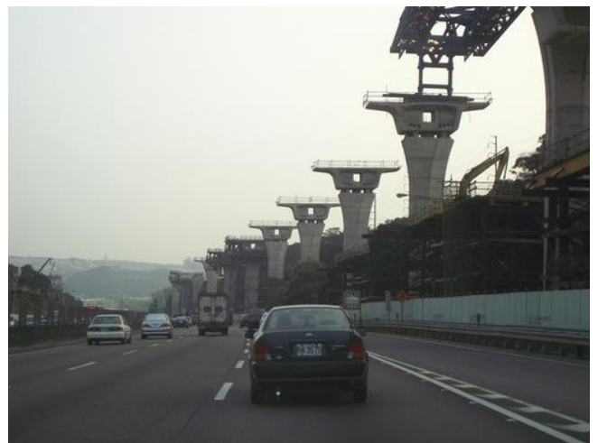
五楊高架路線の建設現場