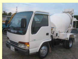
いすゞ ミキサー KK-NKR71E3N H14 ¥1,550,000