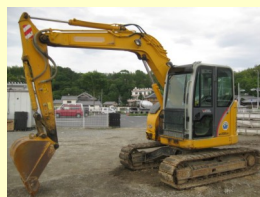
KATO HD308US 2009y ¥3,400,000