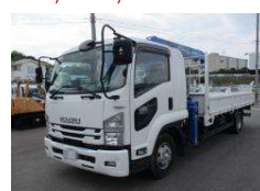
いすゞ 2018 y 2PG-FRR90S2 ¥7,500,000 +TAX