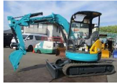
KUBOTA 2012 y RX-306 ¥1,950,000+TAX