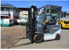
MITSUBISHI 2019 y FB15-8 ¥1,000,000+TAX