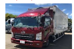
UD 2018 y 2RG-BRR90T2 ASK