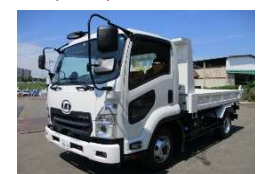
UD 2022 y 2PG-BRR90S2 ¥5,800,000 +TAX