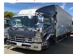
いすゞ 2014 y TKG-FRR90T2 ASK