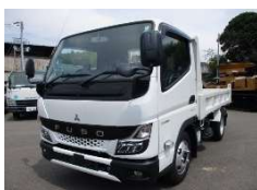
三菱 2t低床 2021 y 2PG-FBA30 ¥3,650,000+TAX