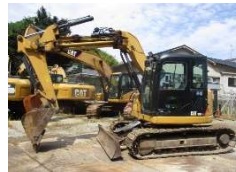
CAT 2013 y 308ESR ¥4,200,000+TAX