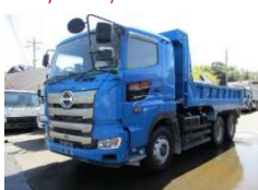
日野 2018 y 2KG-FS1EGA ASK