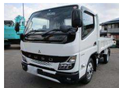
三菱 3t低床 2022 y 2RG-FBA60 ¥3,900,000+TAX