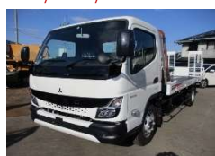
三菱 2021 y 2PG-FEB80 ¥5,900,000 +TAX