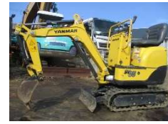
YANMAR 2017 y SV05-B ¥1,200,000 +TAX