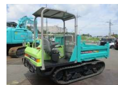
YANMAR 2008 y C30R-2 ¥1,850,000+TAX