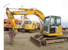
KATO 2012 y HD308US ¥2,800,000+TAX