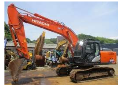
HITACHI 2018 y ZX210K-6 ASK