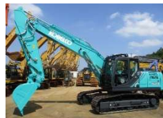
KOBELCO 2021 y SK210D-10 ASK