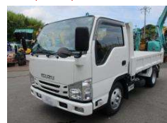
いすゞ 3t低床 2021 y 2RG-NKR88AD ¥4,500,000+TAX