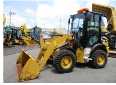
CAT 2017 y 901C2 ASK