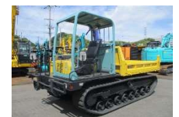
YANMAR 2013 y C50R-3C ¥4,100,000+TAX