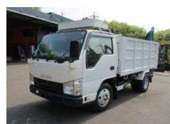
いすゞ 2020 y 2RG-NKR88AN ¥4,500,000+TAX