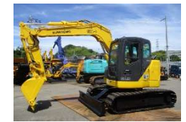
SUMITOMO 2012 y SH75X-3B ¥3,800,000 +TAX