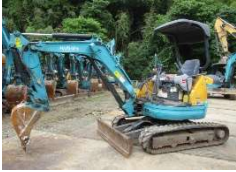
KUBOTA 2014 y U-20-3S ¥1,550,000+TAX