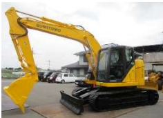
SUMITOMO 2017 y SH135X-6 ASK