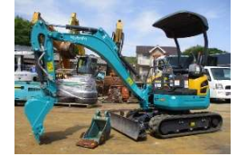
KUBOTA 2021 y U-17-3A ASK