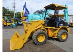
CAT 2006 y 901B ¥1,900,000 +TAX